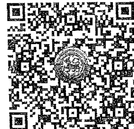
QR Code ๒ ตรวจสอบจำนวนผู้ชำระค่าลงทะเบียนแต่ละรุ่น