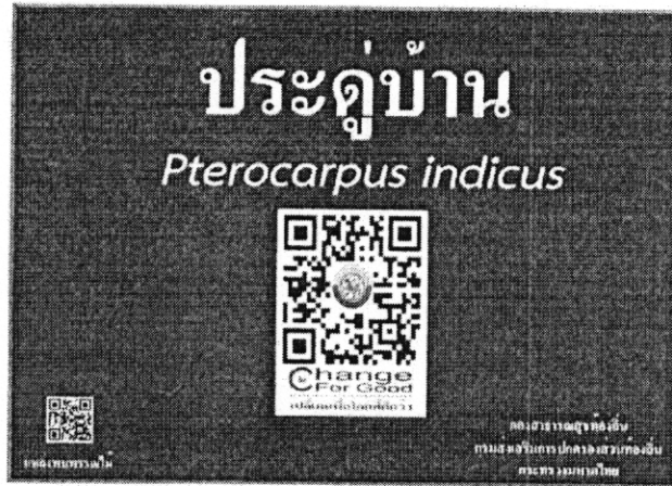
ภาพที่ 1 แสดงรูปแบบป้ายพรรณไม้ท้องถิ่น

ส่วนที่ 5 ชื่อหรือโลโก้หน่วยงานที่จัดทำป้าย ตัวอย่างป้ายแสดงดังภาพด้านล่าง