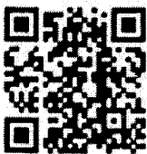
เอกสารแนบ

สำนักพัฒนาระบบบริหารงานบุคคลส่วนท้องถิ่น กลุ่มงานสรรหาและเลือกสรรบุคคลส่วนท้องถิ่น โทร. ๐-๒๒๔๑ - ๙๐๐๐ ต่อ ๒๓๕๒-๓ ไปรษณีย์อิเล็กทรอนิกส์ saraban@dla.go.th