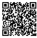
หนังสือกรมบัญชีกลาง

กรมส่งเสริมการปกครองท้องถิ่น ๒๗ พฤษภาคม ๒๕๖๗ ผู้ส่งเสริมการปกครองท้องถิ่น